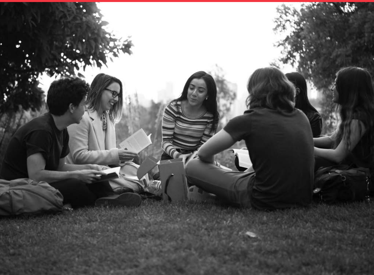
Clase Core Curriculum UAI.

LA UNIVERSIDAD ADOLFO IBÁÑEZ (UAI) ENTREGA UNA EDUCACIÓN BASADA EN LOS PRINCIPIOS DE LA LIBERTAD, DE AHÍ SU LEMA “PENSAR CON LIBERTAD”, Y EN LA RESPONSABILIDAD PERSONAL, QUE PERMITE A SUS ESTUDIANTES DESARROLLAR LA TOTALIDAD DE SU POTENCIAL INTELECTUAL Y HUMANO. PARA LOGRAR ESTO, LA UAI ASUME EL COMPROMISO DE IMPARTIR UNA FORMACIÓN PROFESIONAL CON ALTOS ESTÁNDARES ACADÉMICOS, CONTRIBUIR A EXPANDIR LAS FRONTERAS DEL CONOCIMIENTO A TRAVÉS DE INVESTIGACIÓN DE ALTO NIVEL Y TRANSFERIR ESTOS CONOCIMIENTOS PARA BENEFICIO DE LA SOCIEDAD.